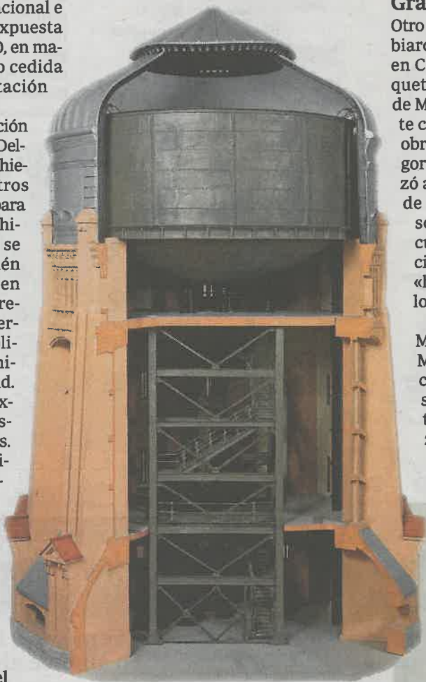
Réplica a escala del depósito elevado de Chamberí

«Maquetas y modelos históricos. Ingeniería y construcción». Conde Duque. C/ Conde Duque, 9. Hasta el 17 de septiembre. Lunes cerrado. Gratis. www.condeduquemadrid.es