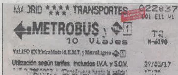
Tradicional billete Metrobus de papel. E.M.

Metro de Madrid anunció que invertirá desde este año hasta 2021 60,6 millones de euros para